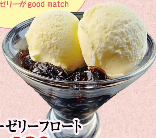
コーヒーゼリーフロート

大人気のロングセラー商品! 優しい甘みのバニラアイスと ほのかな苦みの コーヒーゼリーが good match