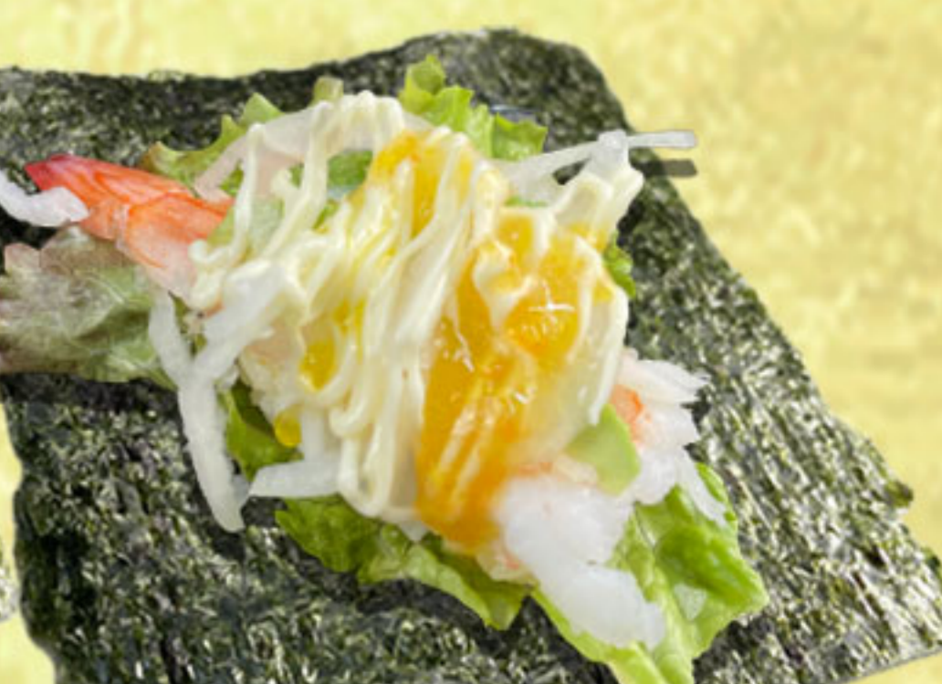
海老サラダ包み 230円(税抜210円)