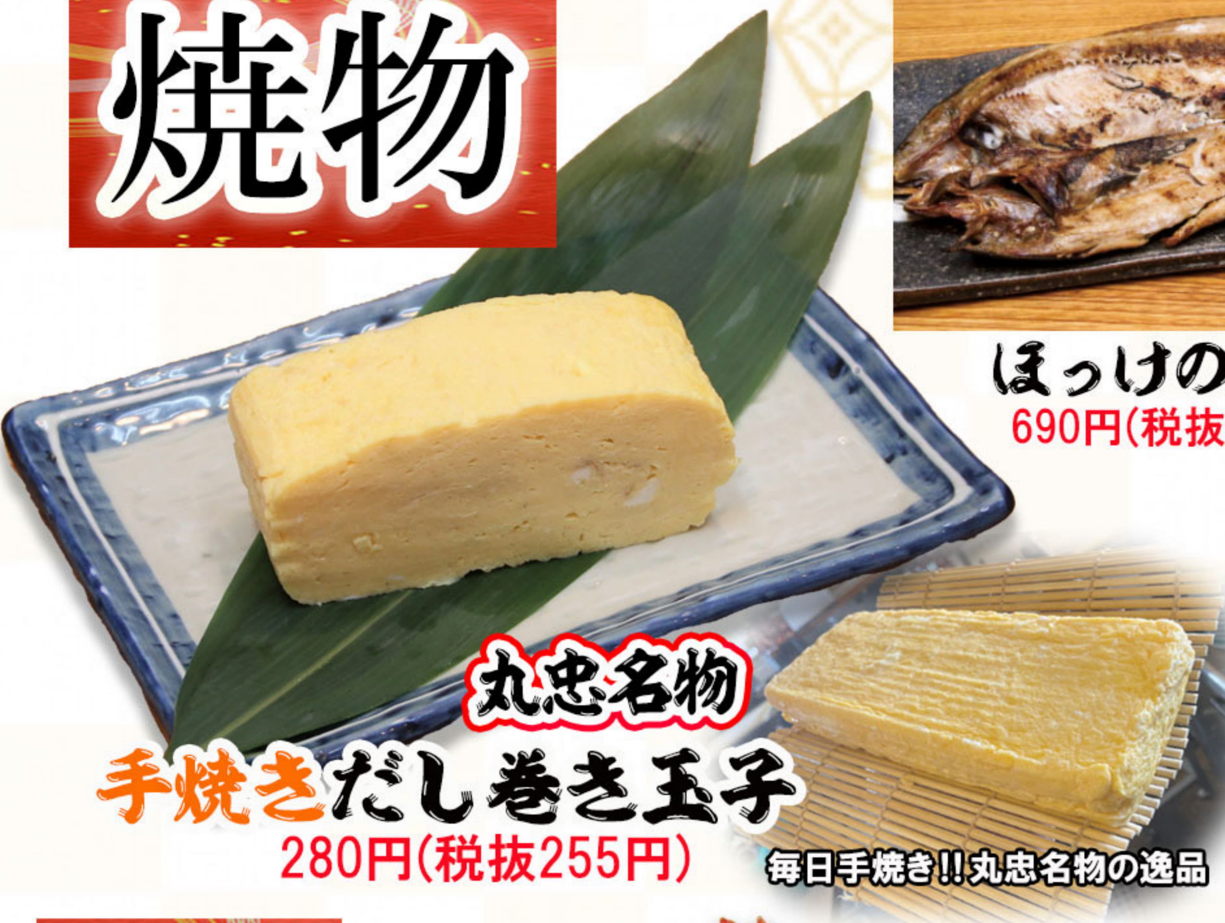
丸忠名物 手焼きだし巻き玉子 280円(税抜255円) 毎日手焼き!!丸忠名物の逸品