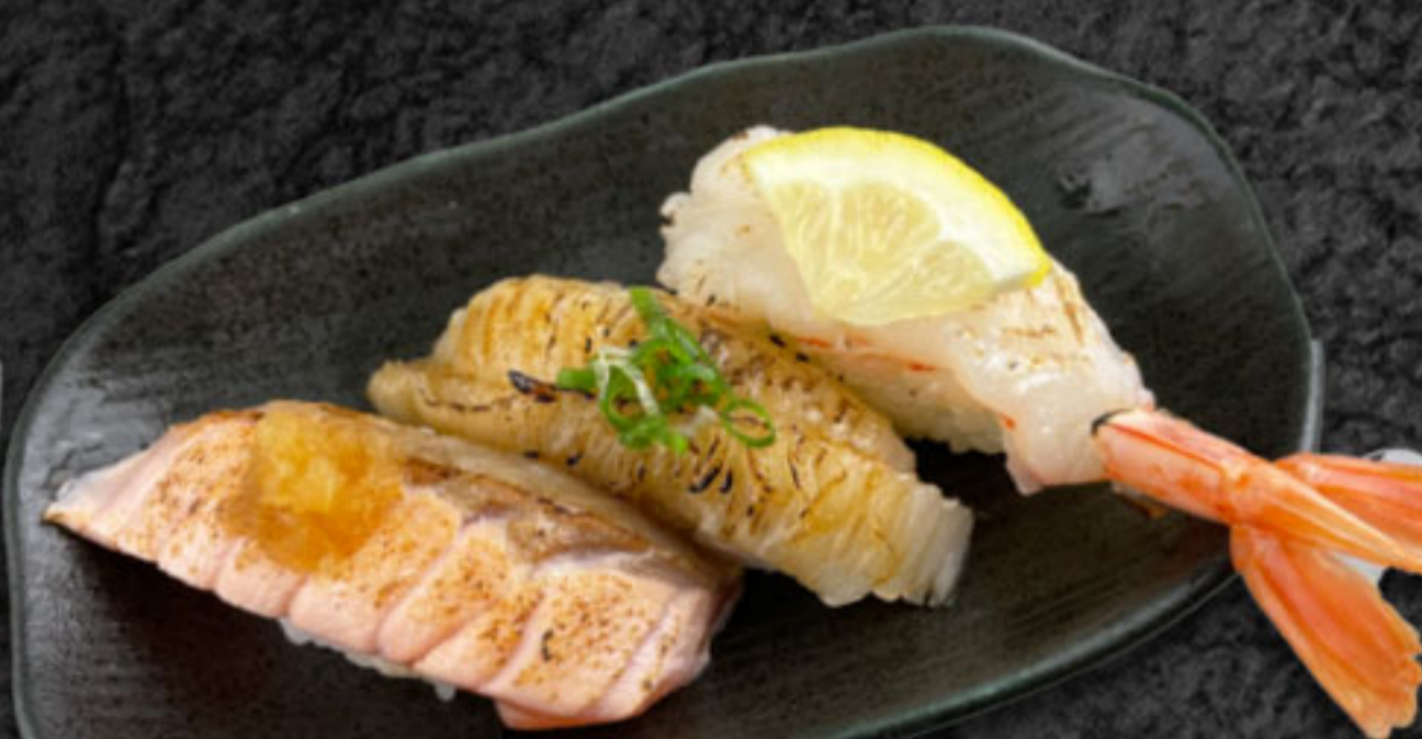
炙りさんまい 600円(税抜546円) サーモン・えんがわ・赤えび