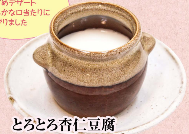
とろとろ杏仁豆腐