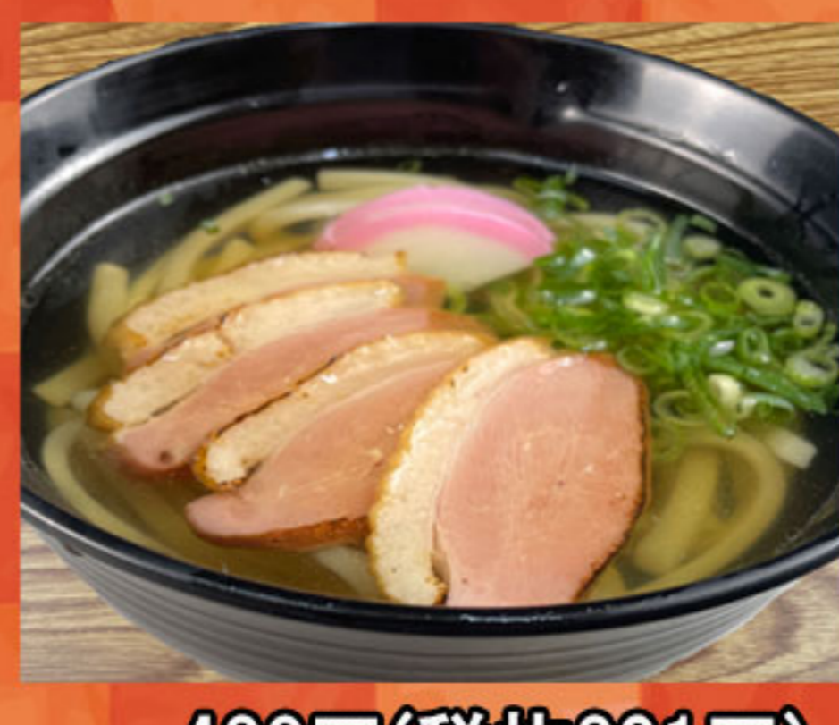
鴨だしうどん 430円(税抜391円)