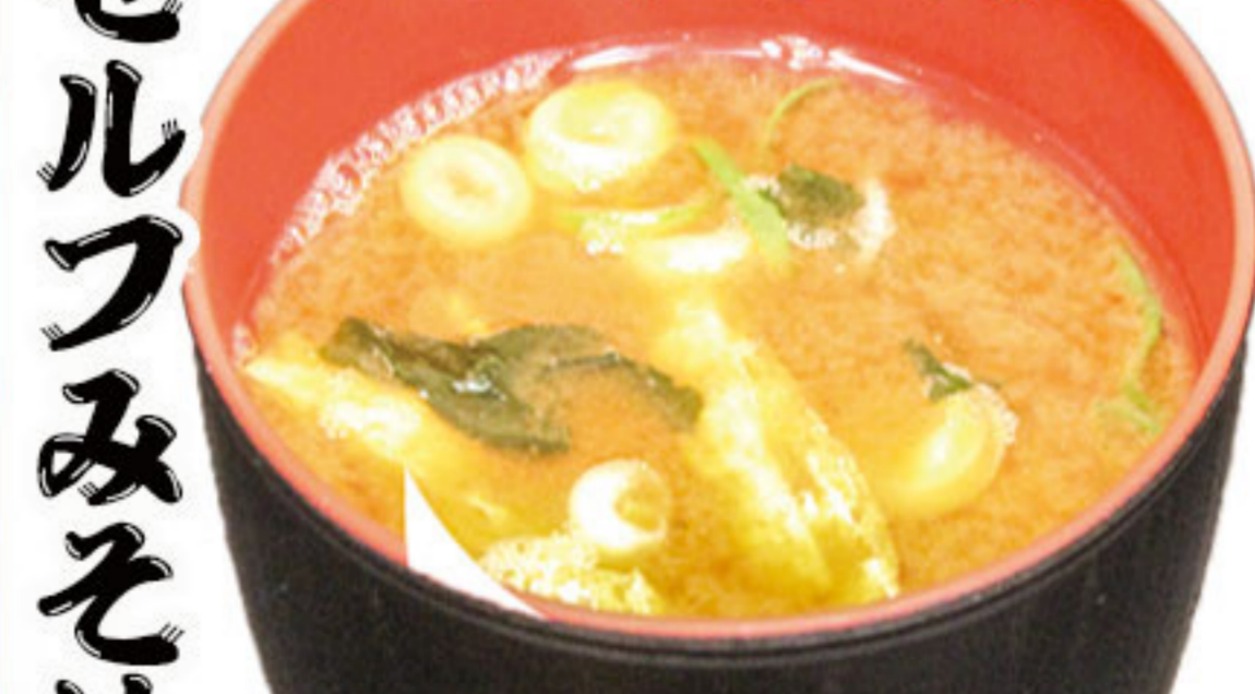
セルフみそ汁 230円(税抜210円)