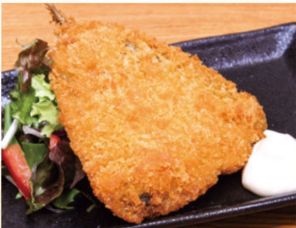
アジフライ 350円(税抜319円)