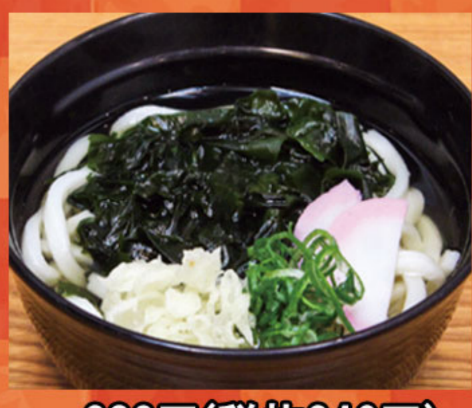
わかめうどん 380円(税抜346円)