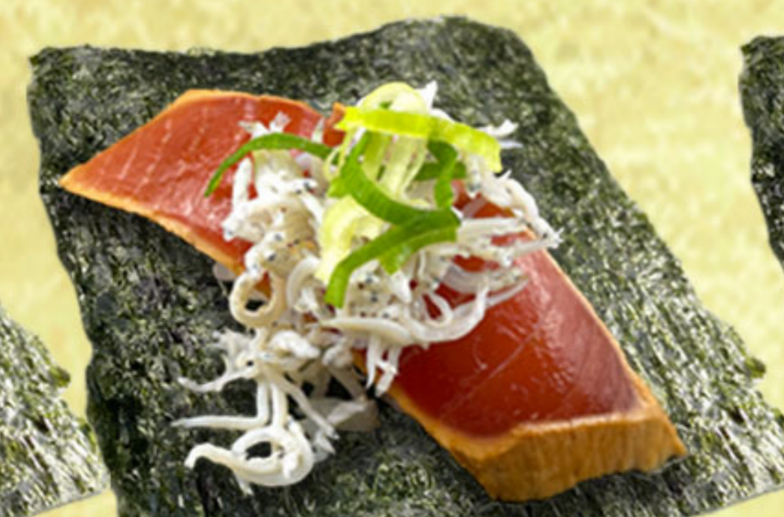
漬まぐろじゃこまみれ包み 330円(税抜300円)