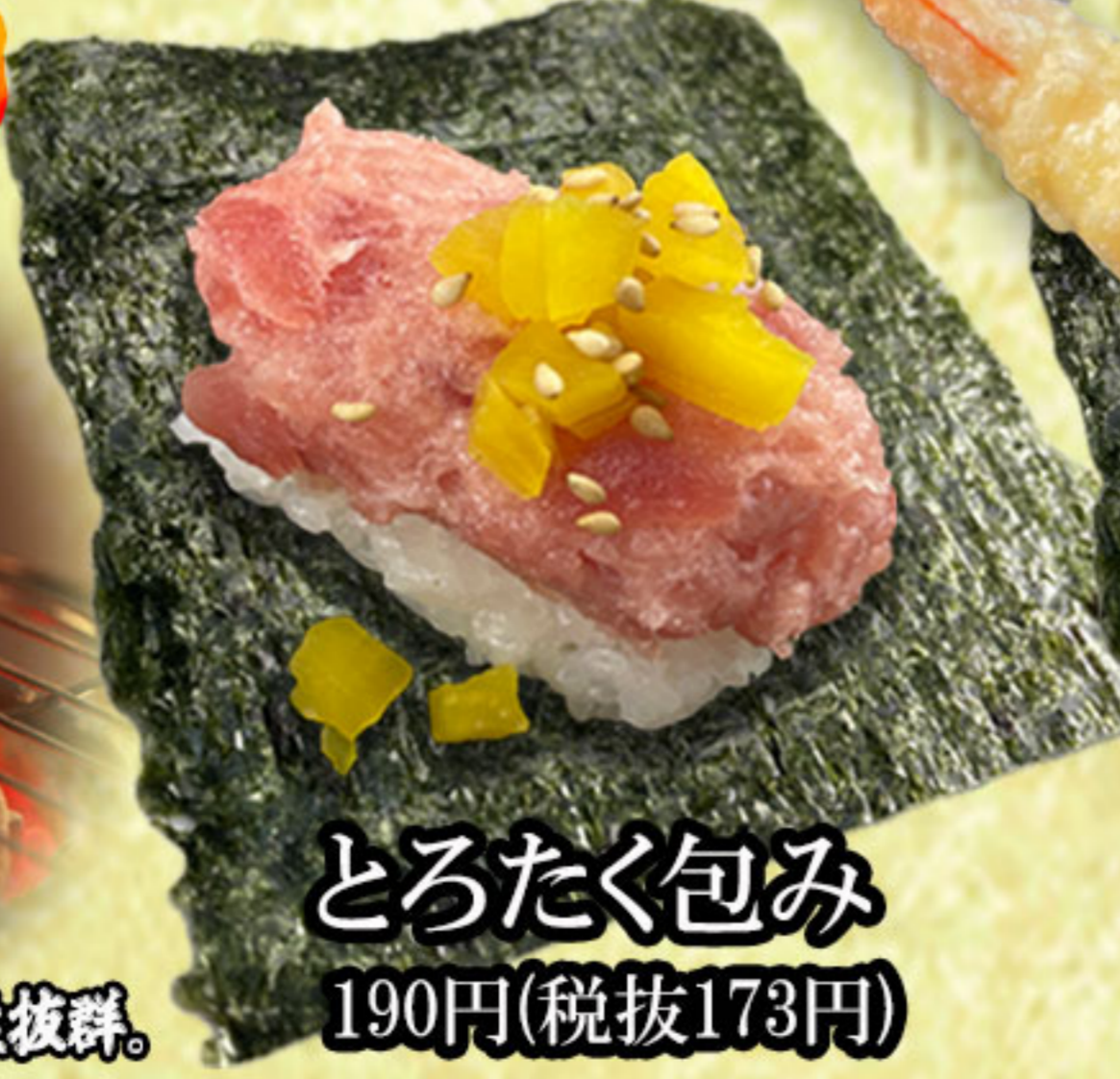
とろたく包み 190円(税抜173円)