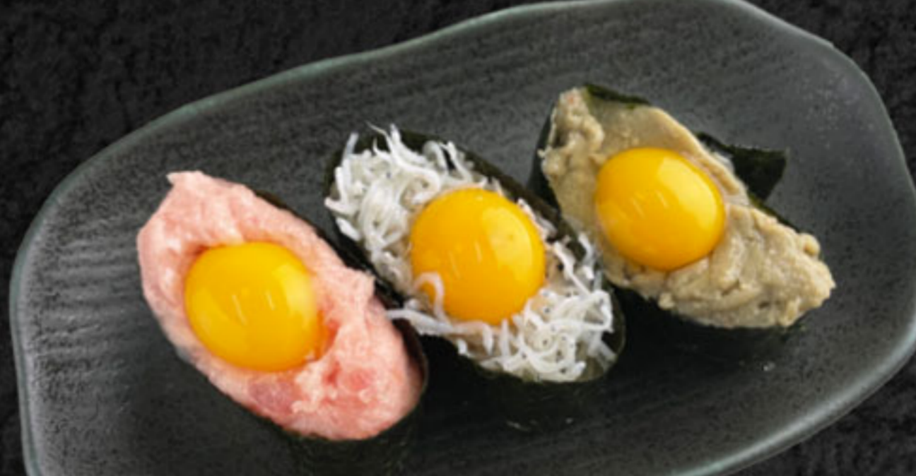
月見3貫盛り 480円(税抜437円) ねぎとろ・じゃこ・カニみそ