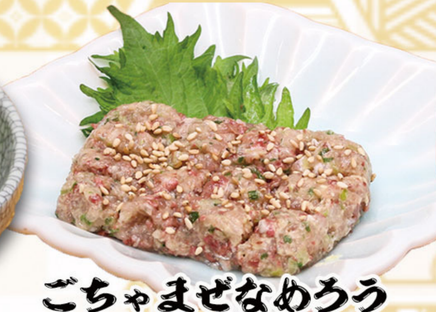
ごちゃまぜなめろう