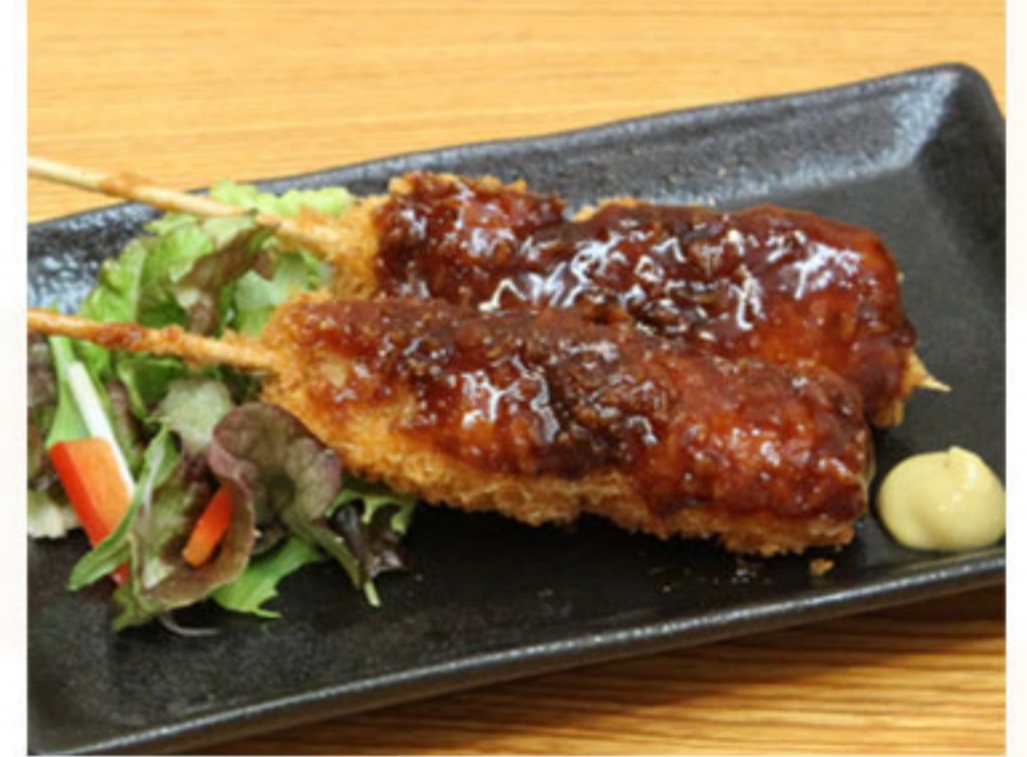
みそ串かつ 430円(税抜391円)