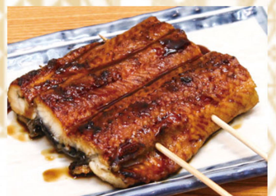
うなぎ蒲焼き 1100円(税抜1000円)