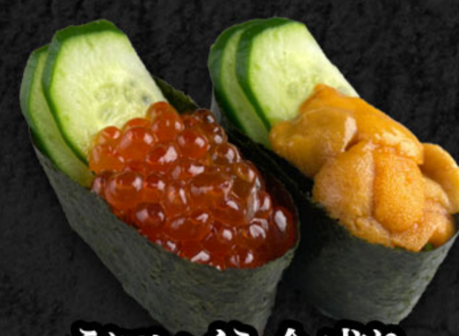
うどんいくら合盛り 850円(税抜773円) いくら・うどん