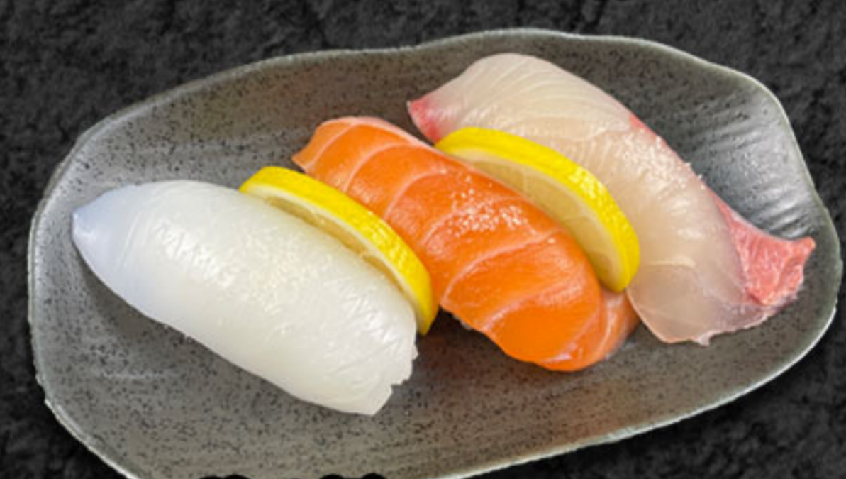
レモン塩3貫 630円(税抜573円) いか・サーモン・かんぼち