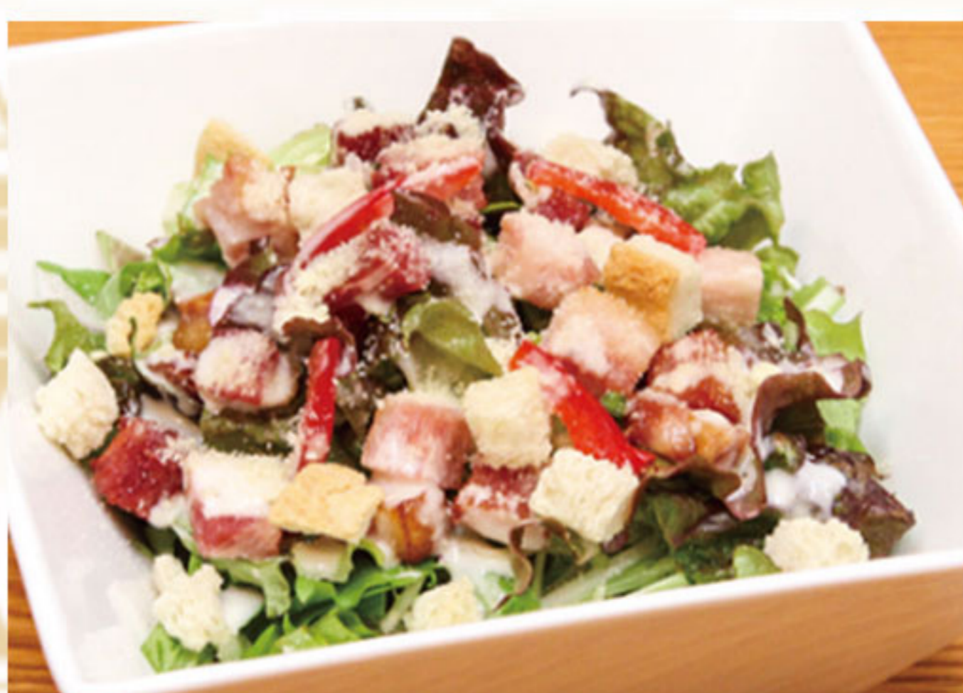
たっぷりベーコンの シーザーサラダ