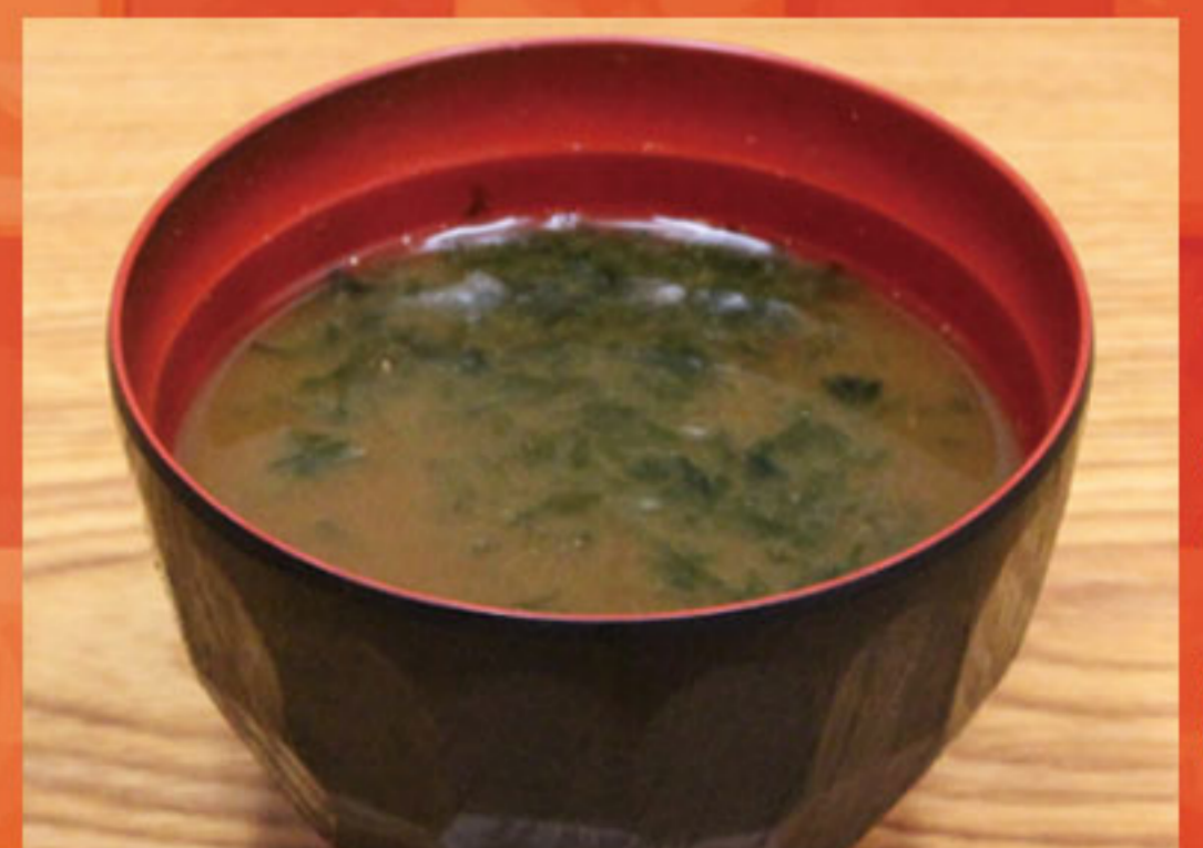
あおさ汁 230円(税抜210円)