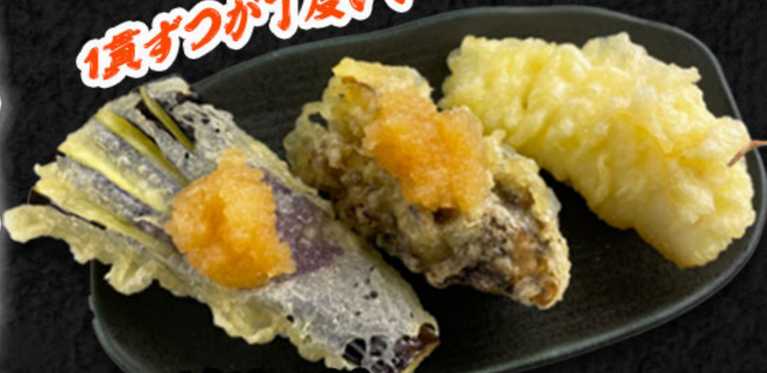
天ぷら3貫 460円(税抜419円) なす天・舞茸天・いか天