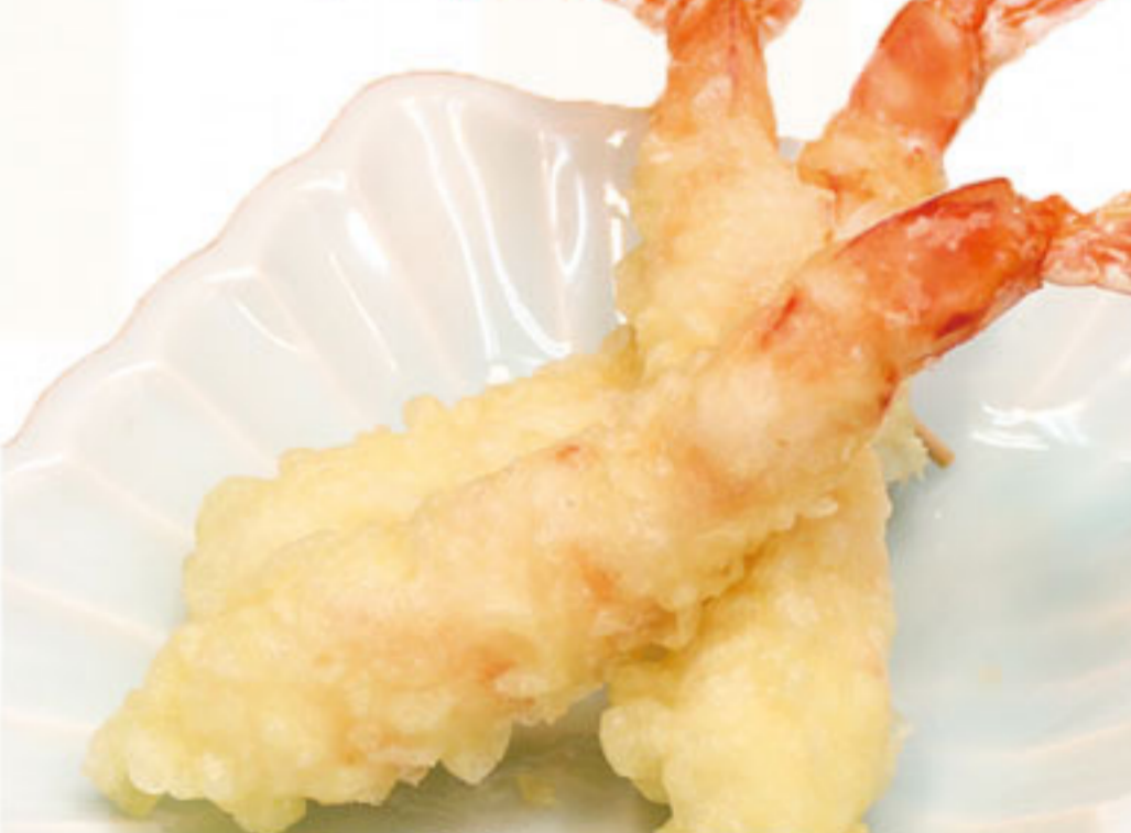
えびの天ぷら 690円(税抜628円)