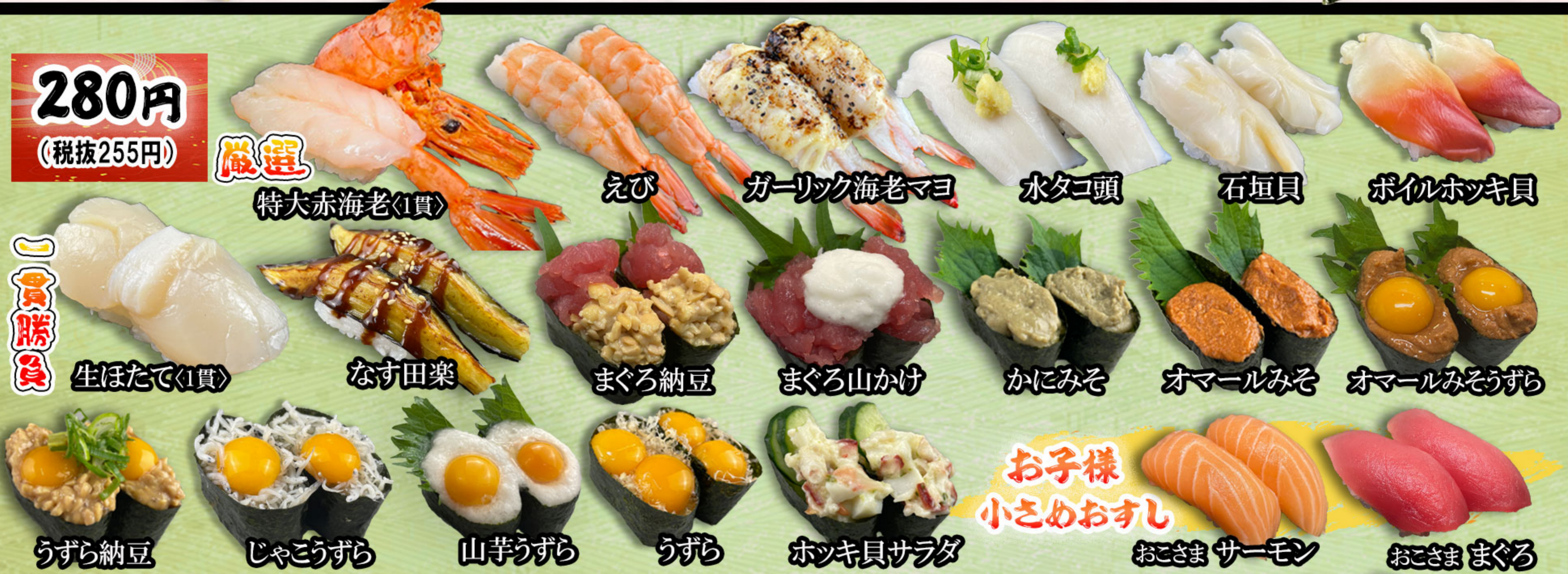
厳選 特大赤海老(1貫)