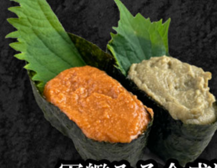
軍艦みそ合盛り 280円(税抜255円) オマールみそ・かにみそ