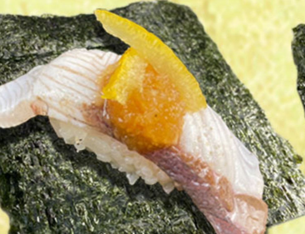
炙りはまちおろし包み 330円(税抜300円)