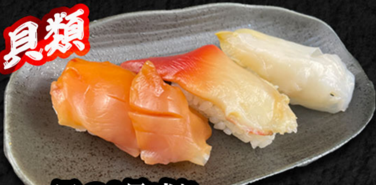
貝の3貫盛り 580円(税抜528円) 赤貝・ボイルホッキ貝・つぶ貝