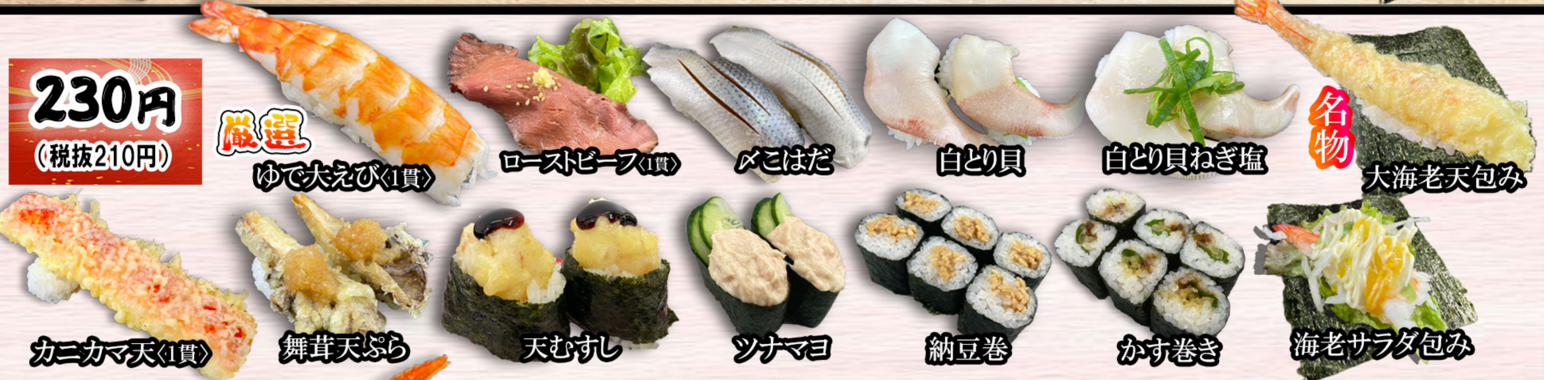
厳選 ゆで大えび(1貫)