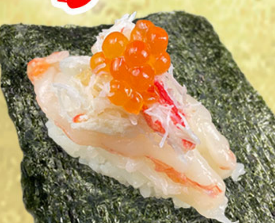
赤えび北海包み 380円(税抜346円)