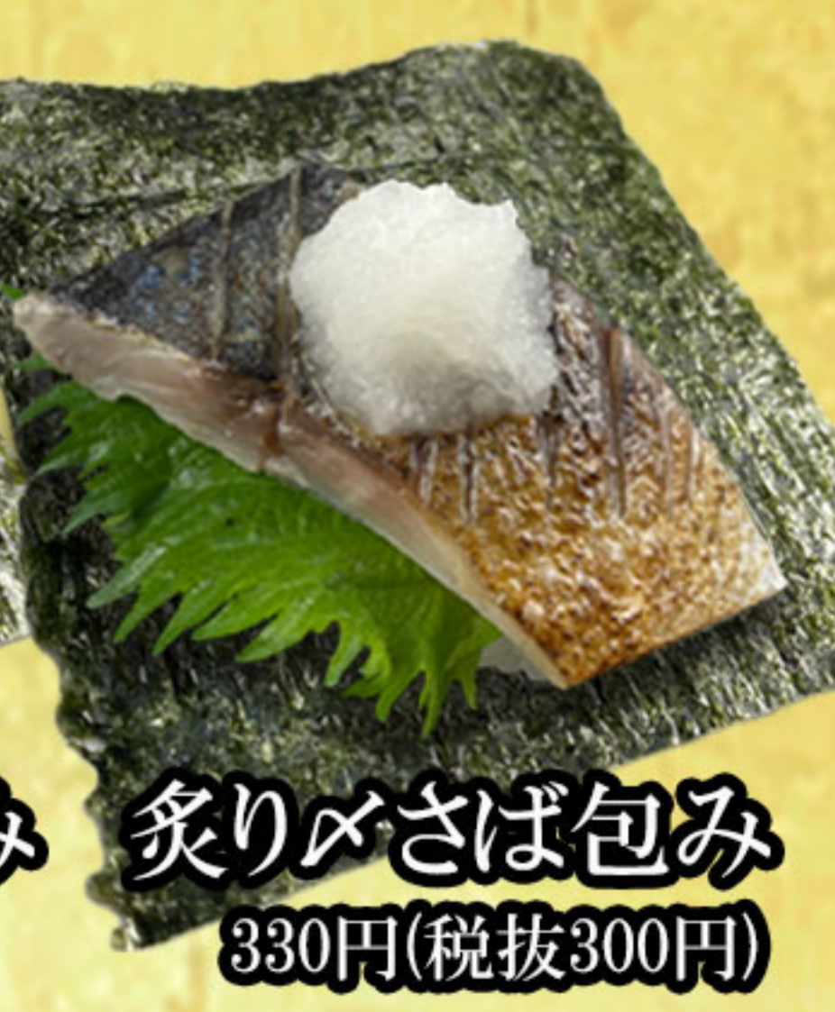
炙りメさば包み 330円(税抜300円)