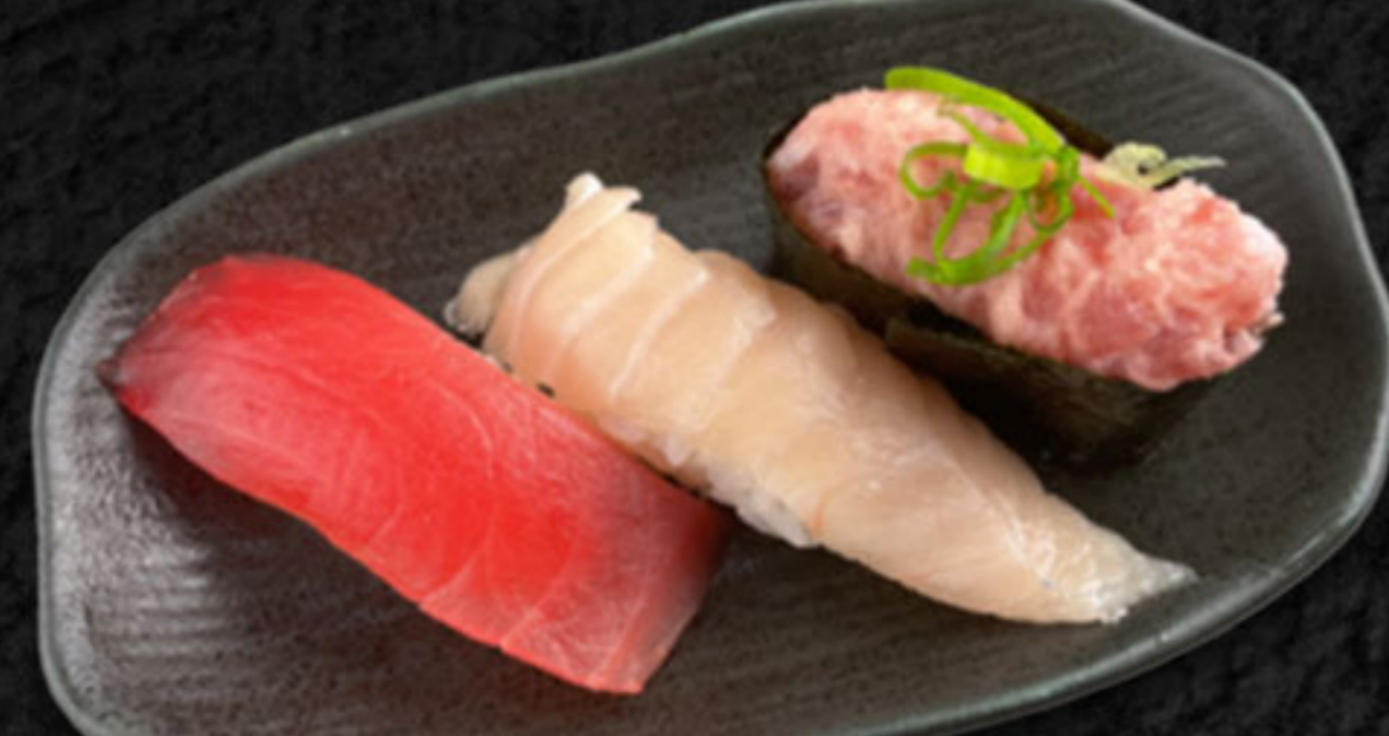
まぐろ3種 520円(税抜473円) まぐろ・びんちょうまぐろ・ねぎとろ