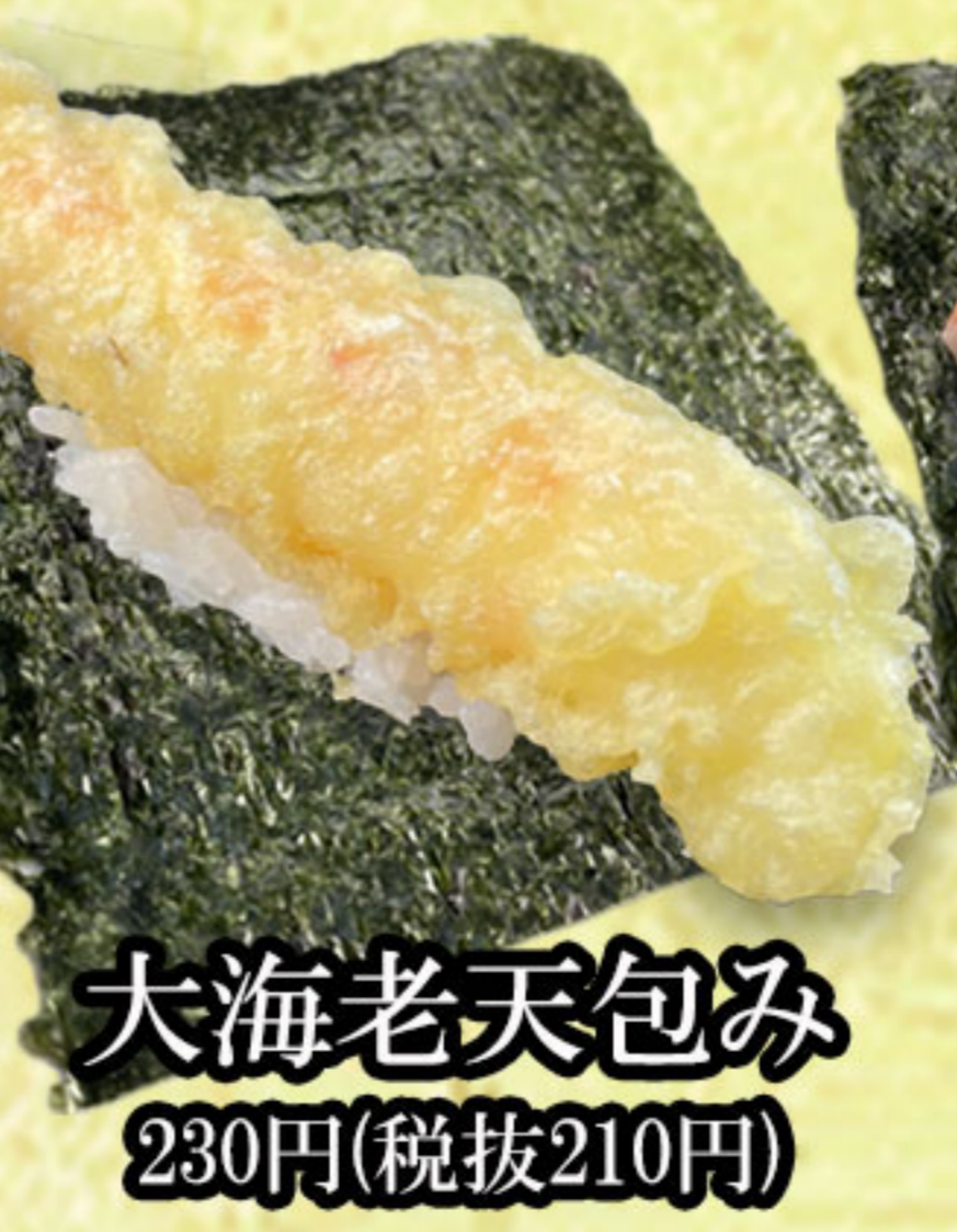
大海老天包み 230円(税抜210円)