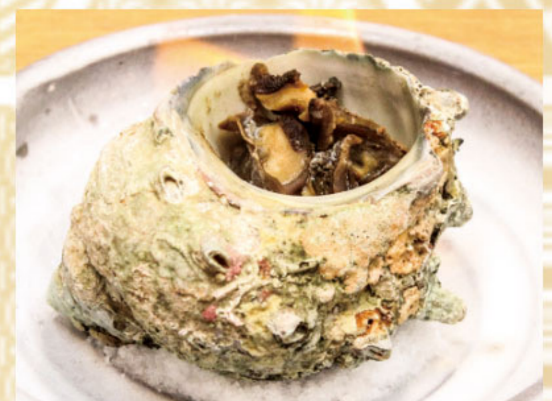
さぞえのつぼ焼き 690円(税抜628円)