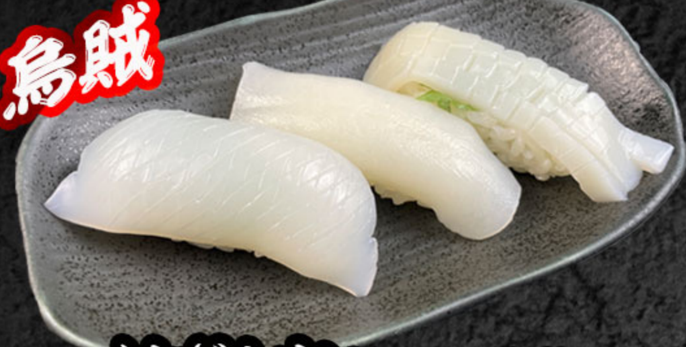
イカさんまい 580円(税抜528円) 紋甲いか・たるいか・真イカ