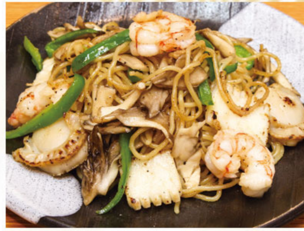
海鮮塩焼きそば 990円(税抜900円)