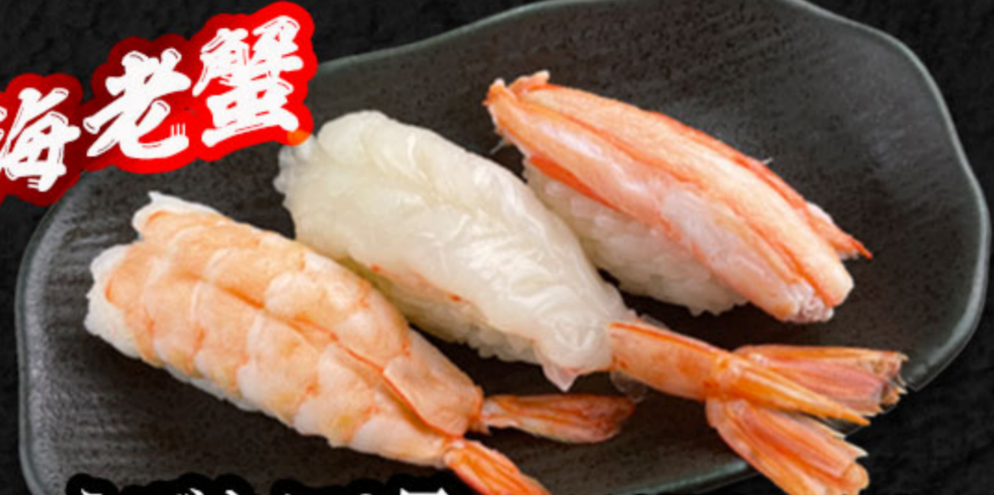
えびかに3貫 600円(税抜546円) えび・赤えび・紅ズワイガニ