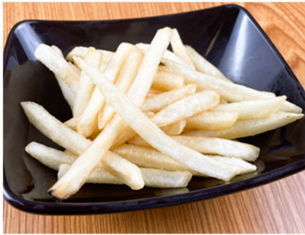
ポテトフライ 280円(税抜255円)