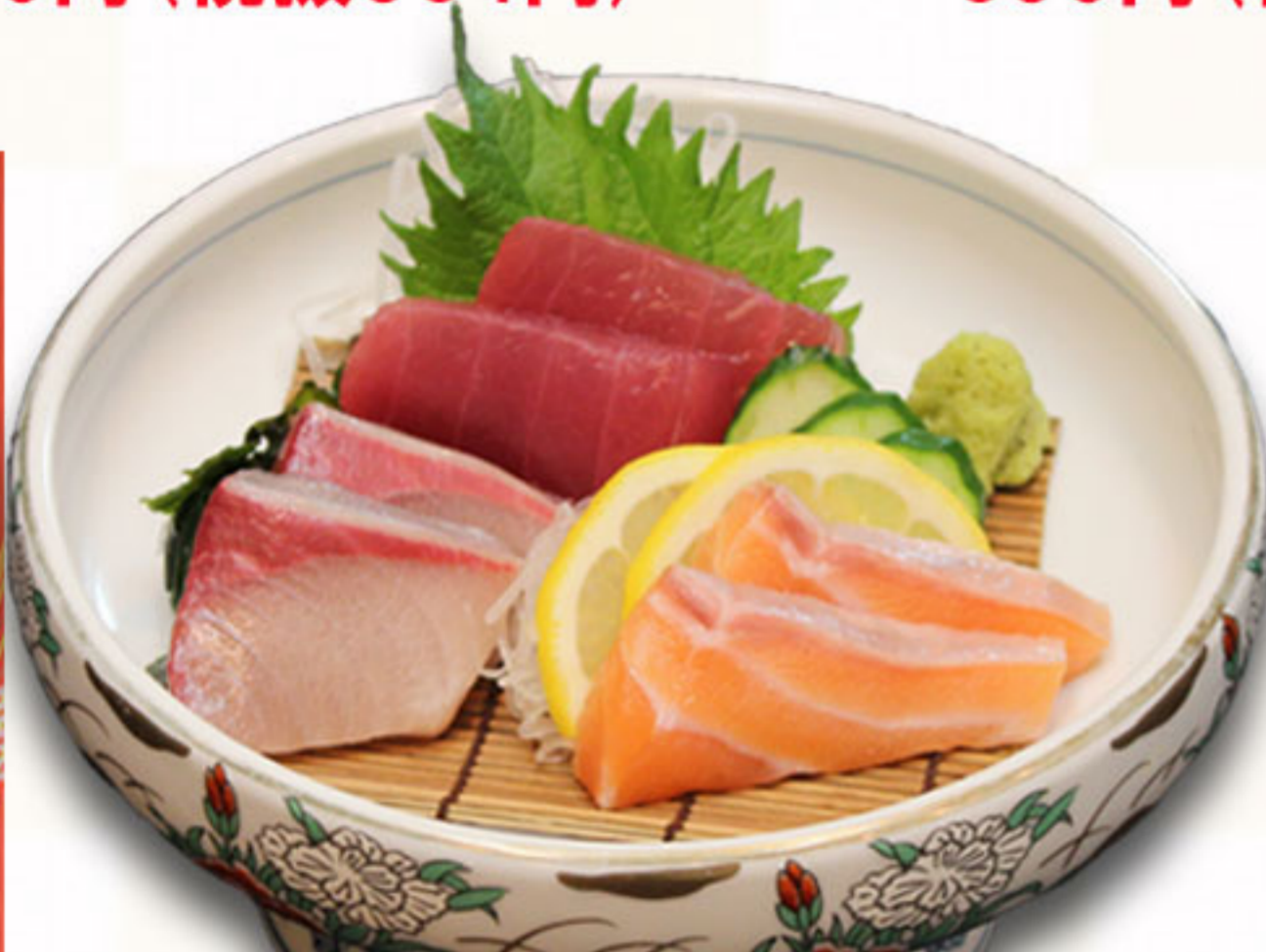
日替わり刺身3種盛り