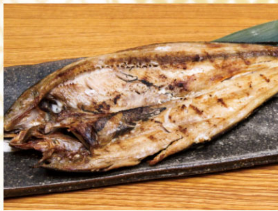
ほっけの開き 690円(税抜628円)