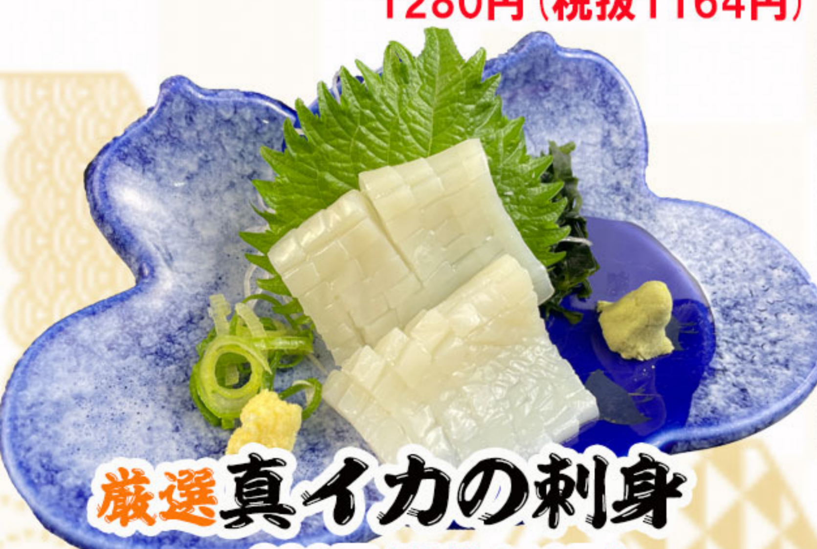
厳選真イカの刺身