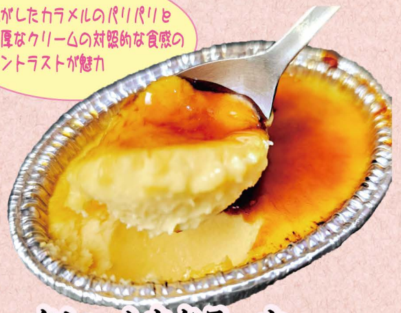
クレーンカタラーナ

焦がしたカaramelのバリバリと 濃厚なクールの対照的な食感の コントラストが魅力