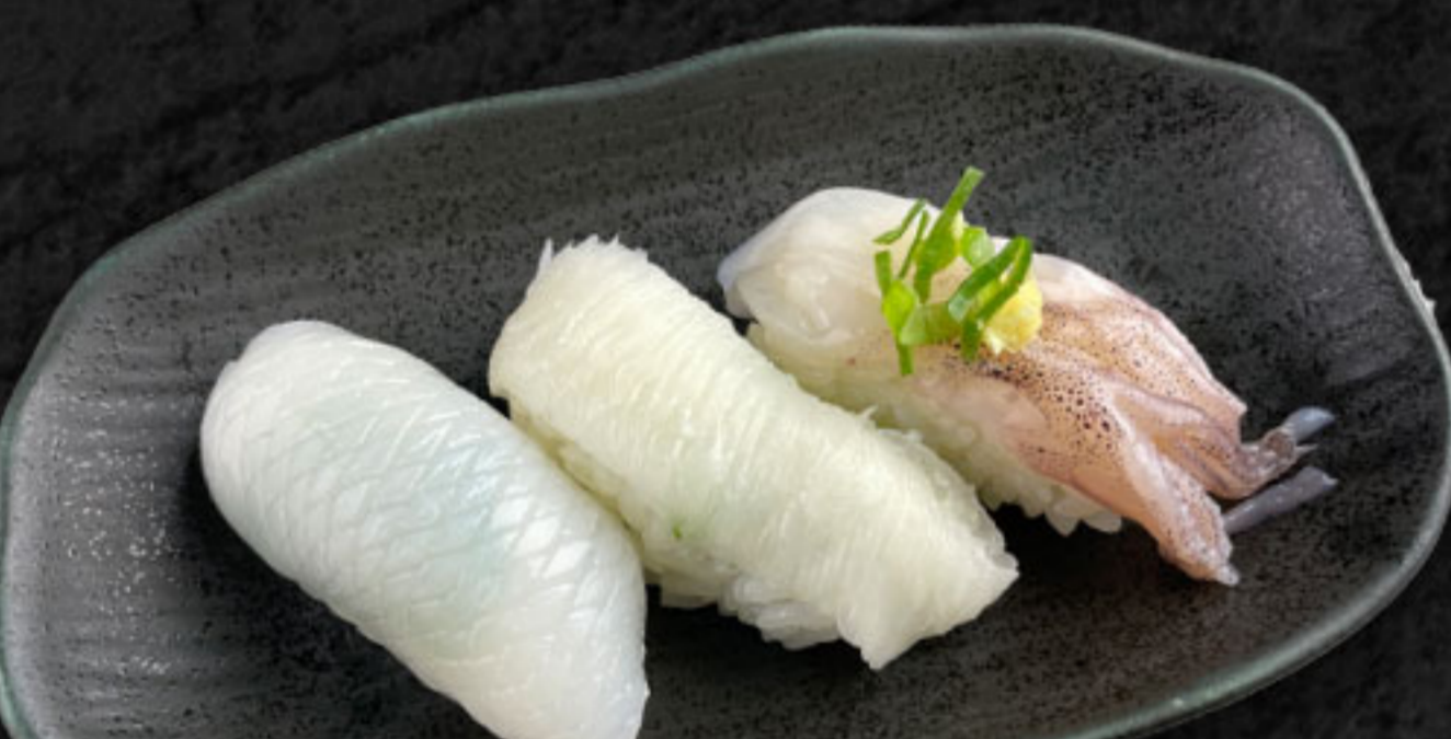
ホワイトスリー 480円(税抜437円) 紋甲いか・えんがわ・生ゲソ