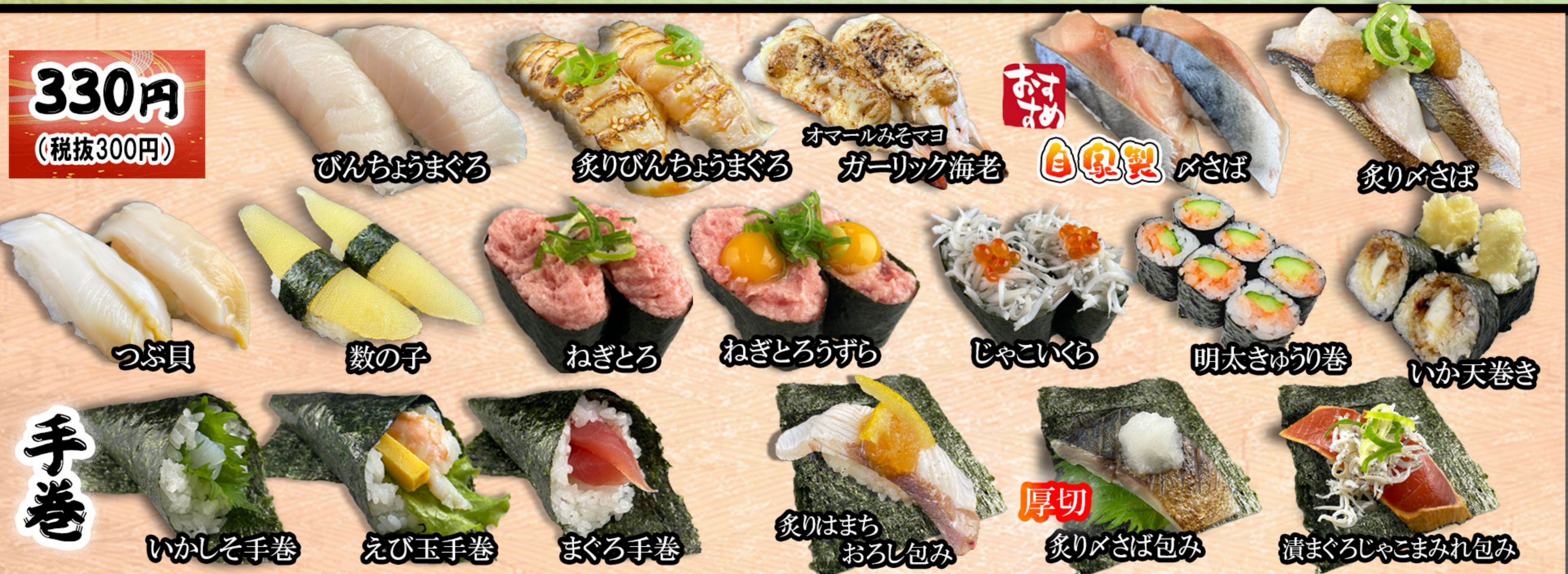
びんちょうまぐろ