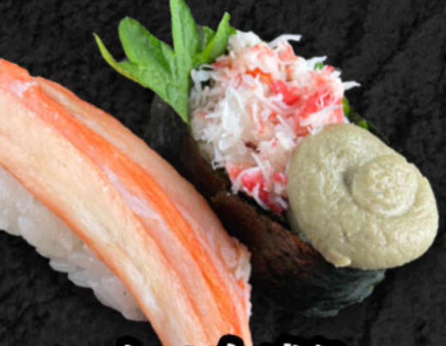
カニ合盛り 530円(税抜482円) 紅ズワイガニ・かに合せ