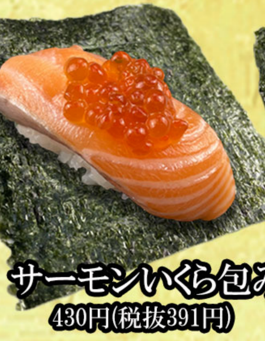
サーモンいくら包み 430円(税抜391円)