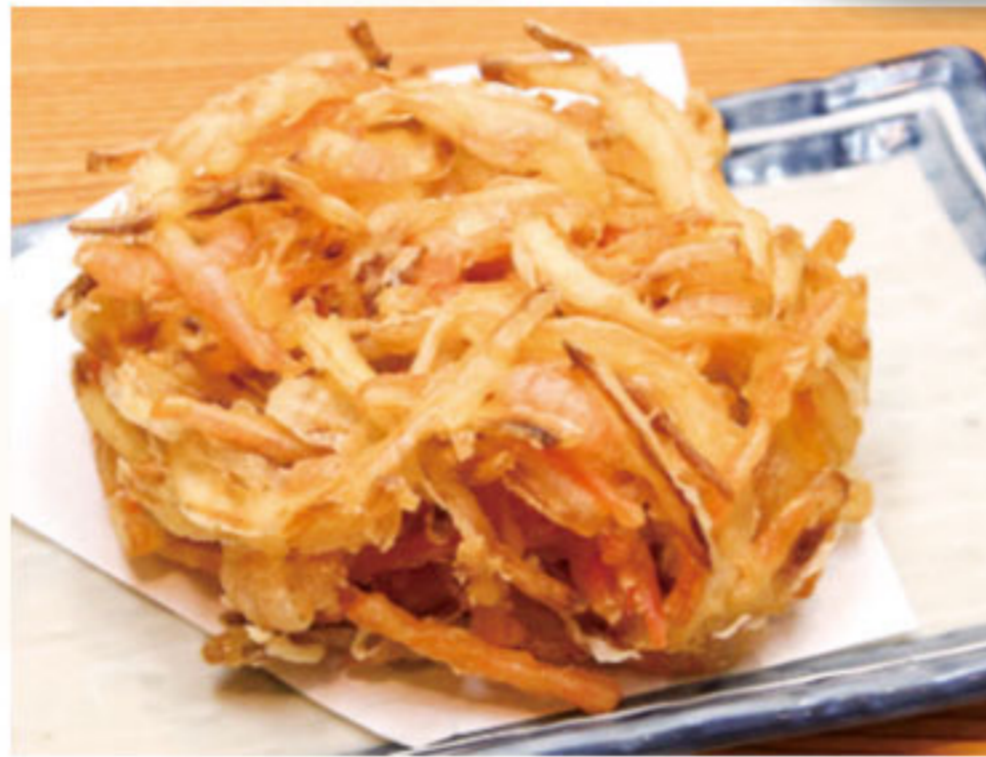
海老のかき揚げ 400円(税抜364円)