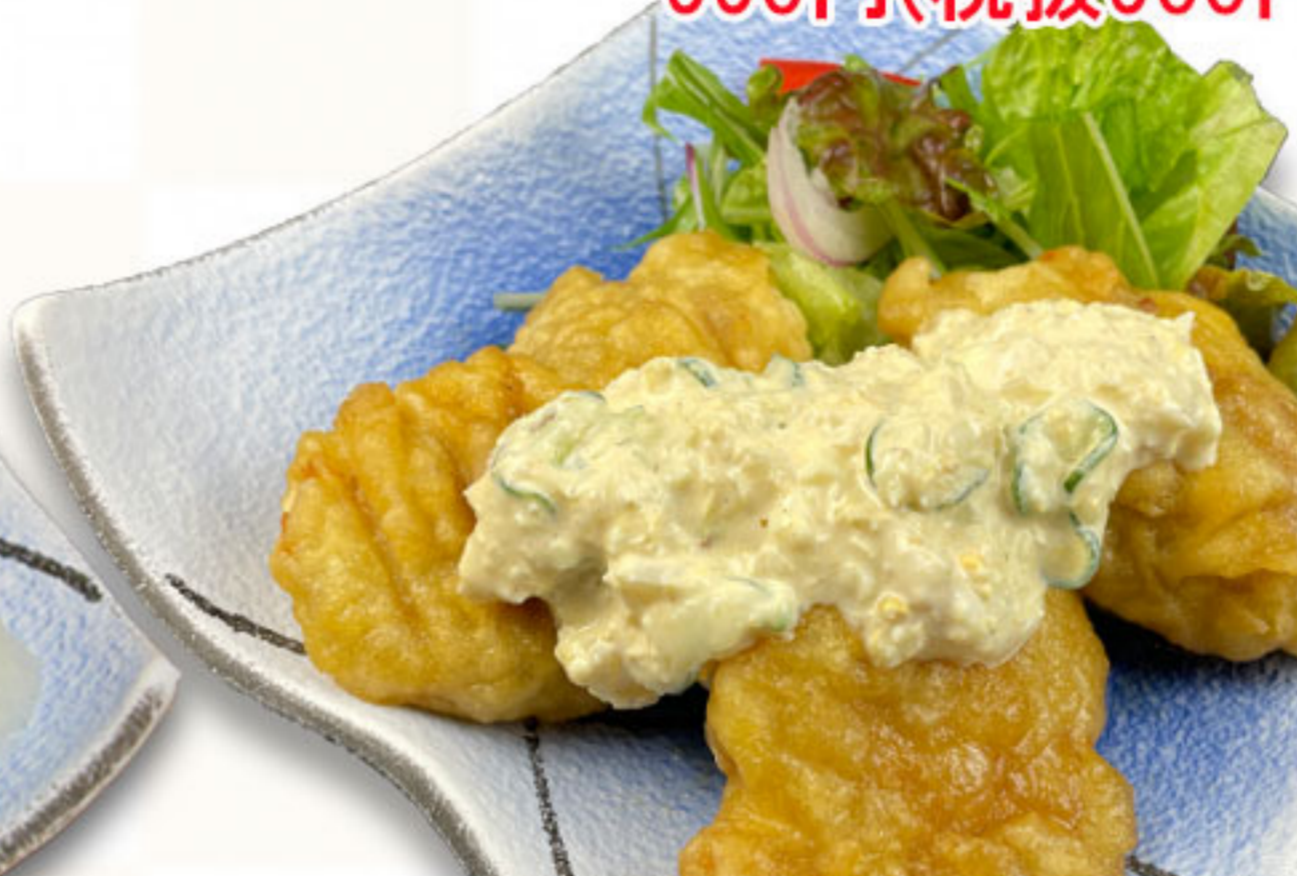
チキン南蛮 630円(税抜573円)