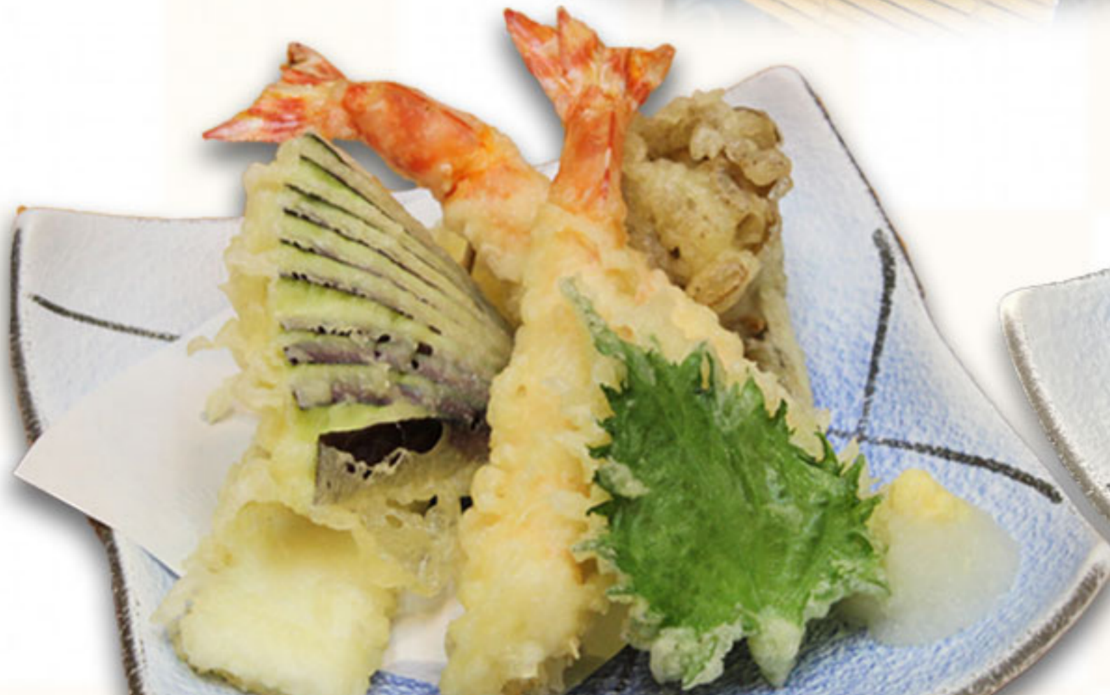
天ぷら盛り合わせ 890円(税抜810円)