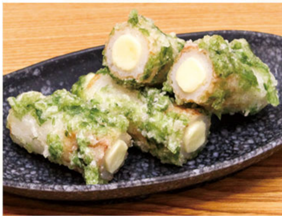
ちくわ磯辺チーズ 460円(税抜419円)