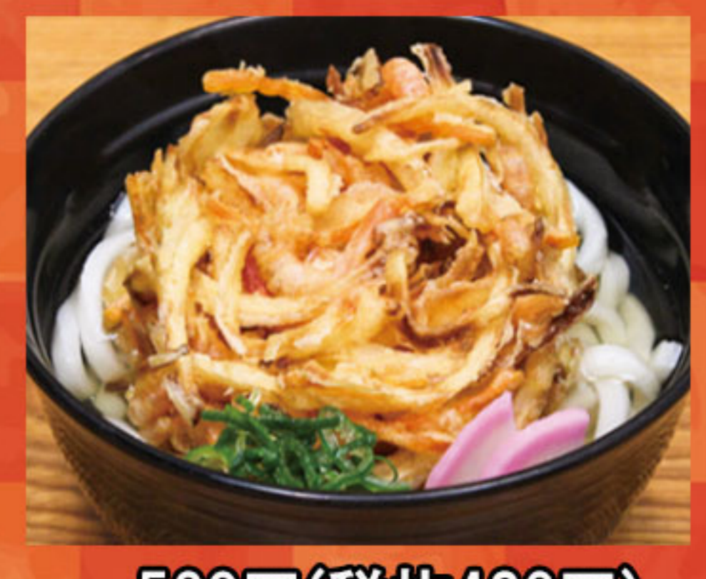
かき揚げうどん 530円(税抜482円)