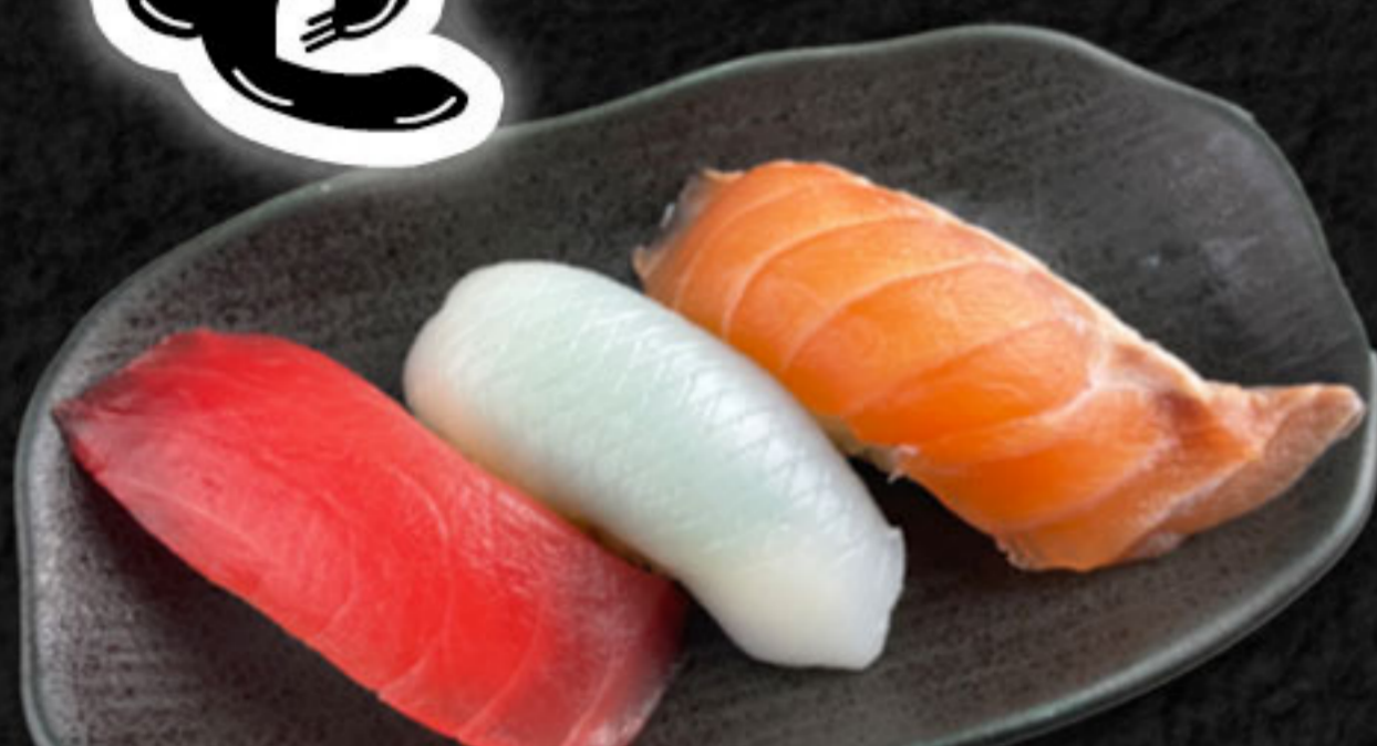
定番3貫盛り 600円(税抜546円) まぐろ・紋甲いか・サーモン