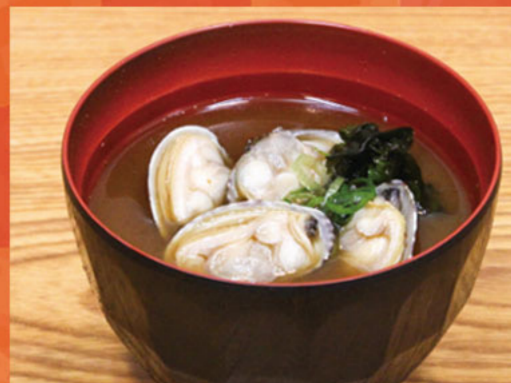
あさり汁 280円(税抜255円)