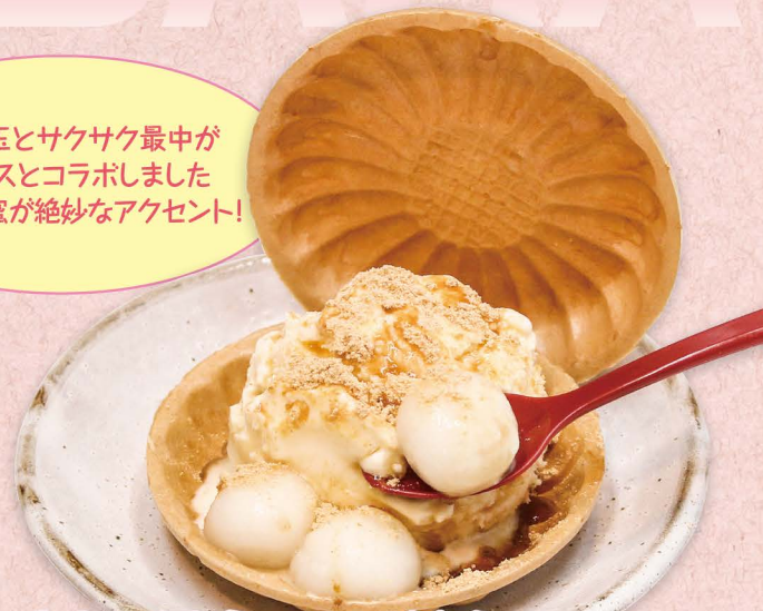
きなこ黒蜜バニラ最中

もちもち白玉とサクサク最中が バニラアイスとコラボしました きなこ黒蜜が絶妙なアクセント!