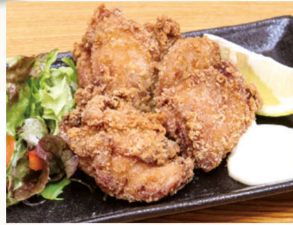
鶏の唐揚げ 460円(税抜419円)