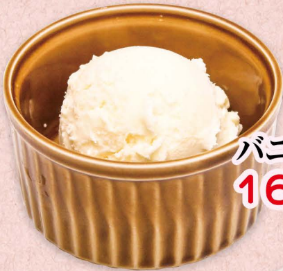
バニラアイスクリーム