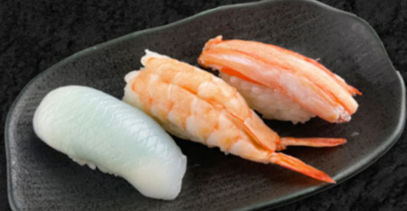
人気者3種 600円(税抜546円) 紋甲いか・えび・紅ズワイガニ