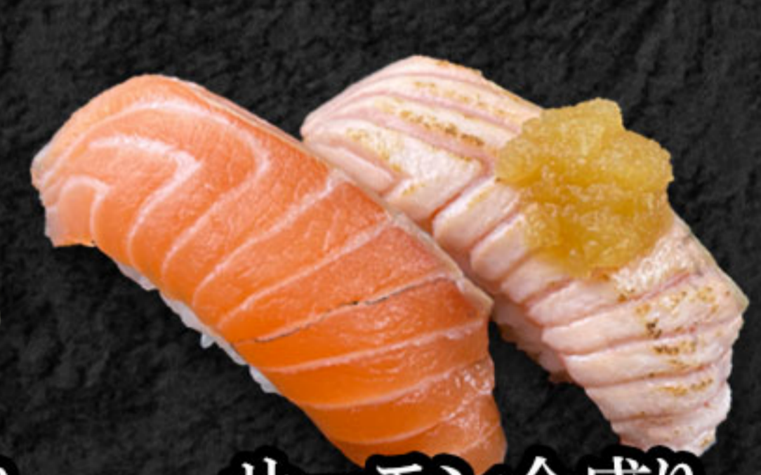
サーモン合盛り 430円(税抜391円) 生サーモン・炙りサーモン