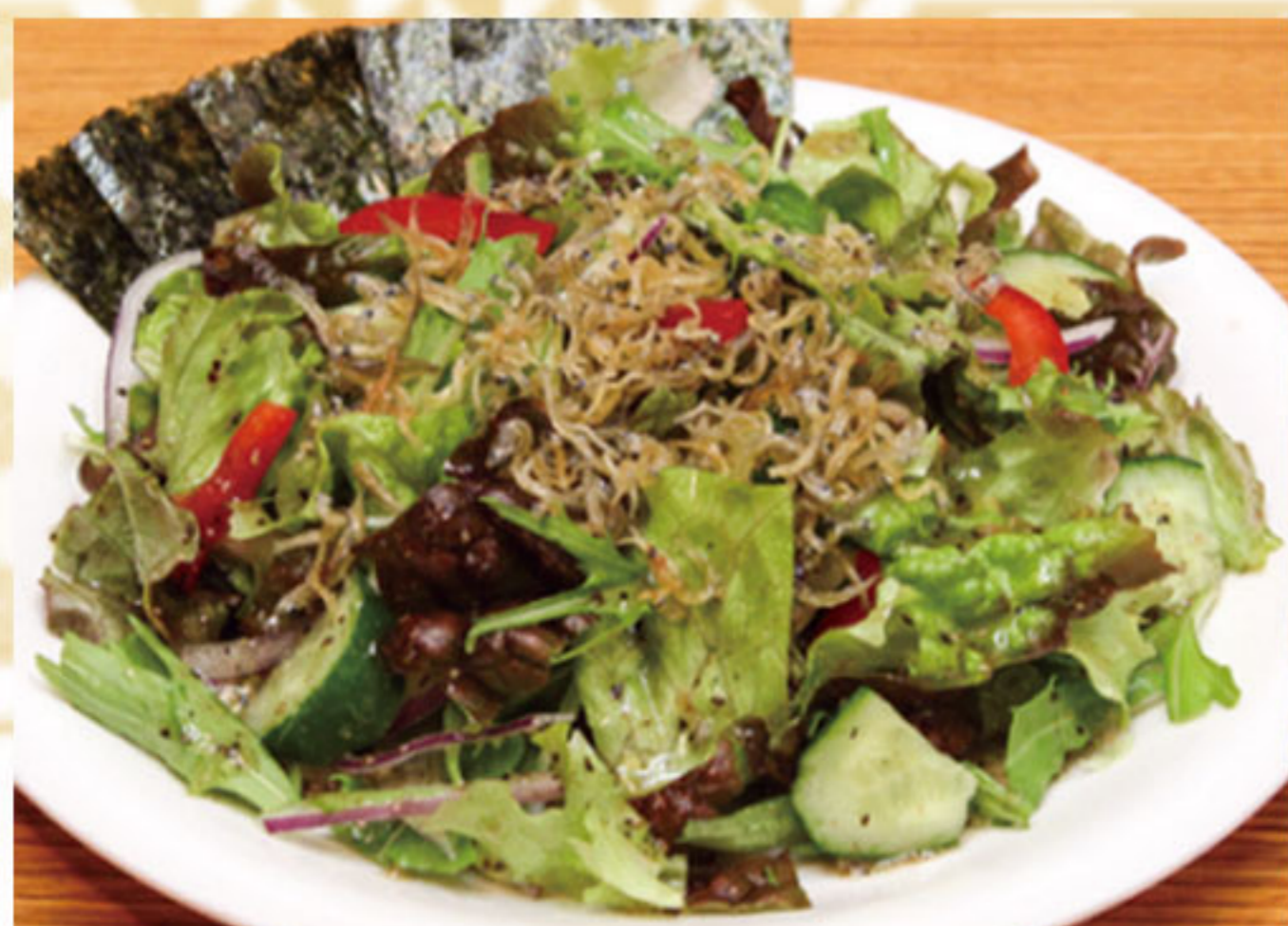
かりかりじゃこのせ チョレギサラダ