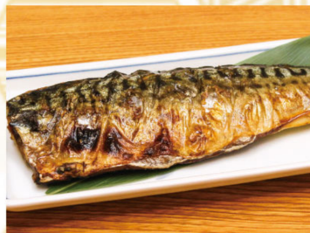
さばの塩焼き 580円(税抜528円)