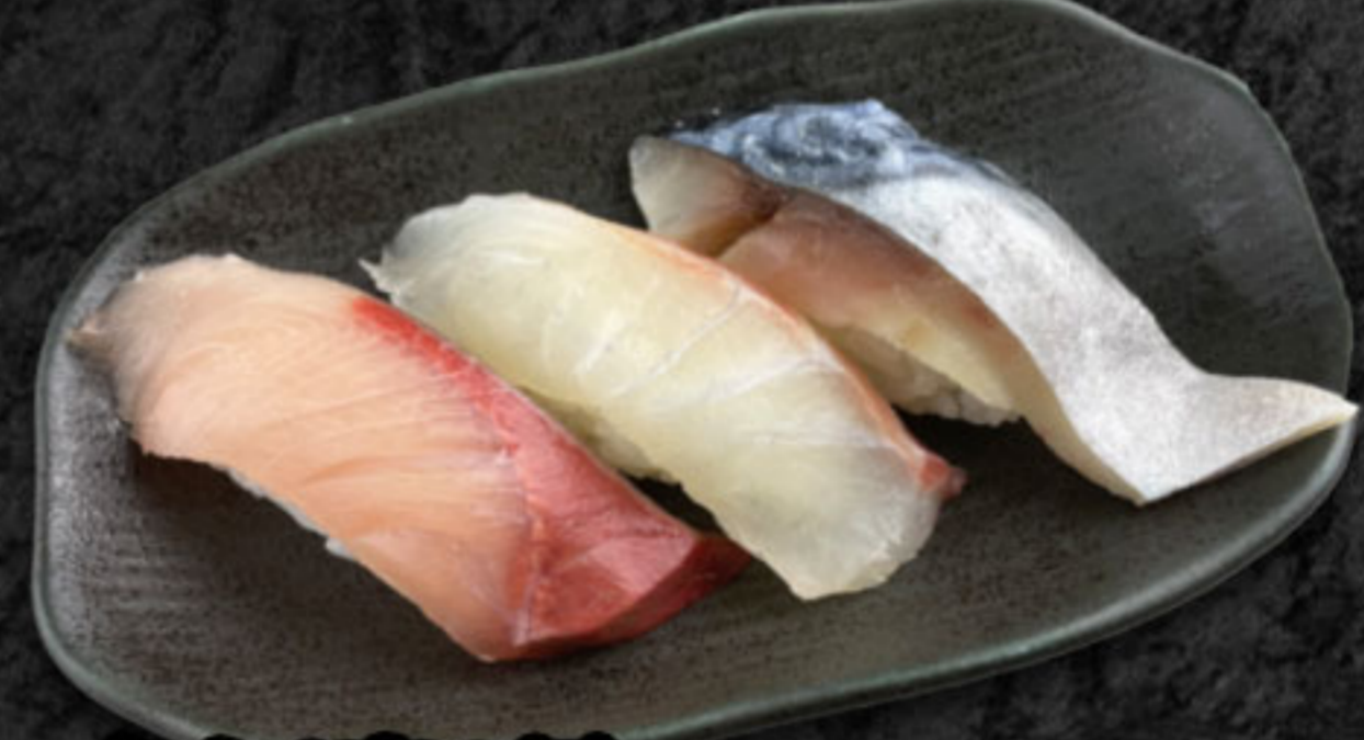
魚河岸3貫 630円(税抜573円) はまち・まだい・メさば