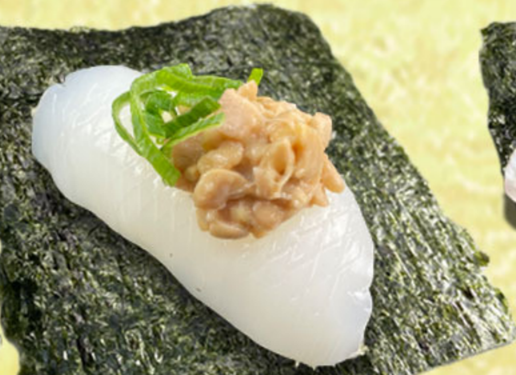
紋甲いか納豆包み 190円(税抜173円)