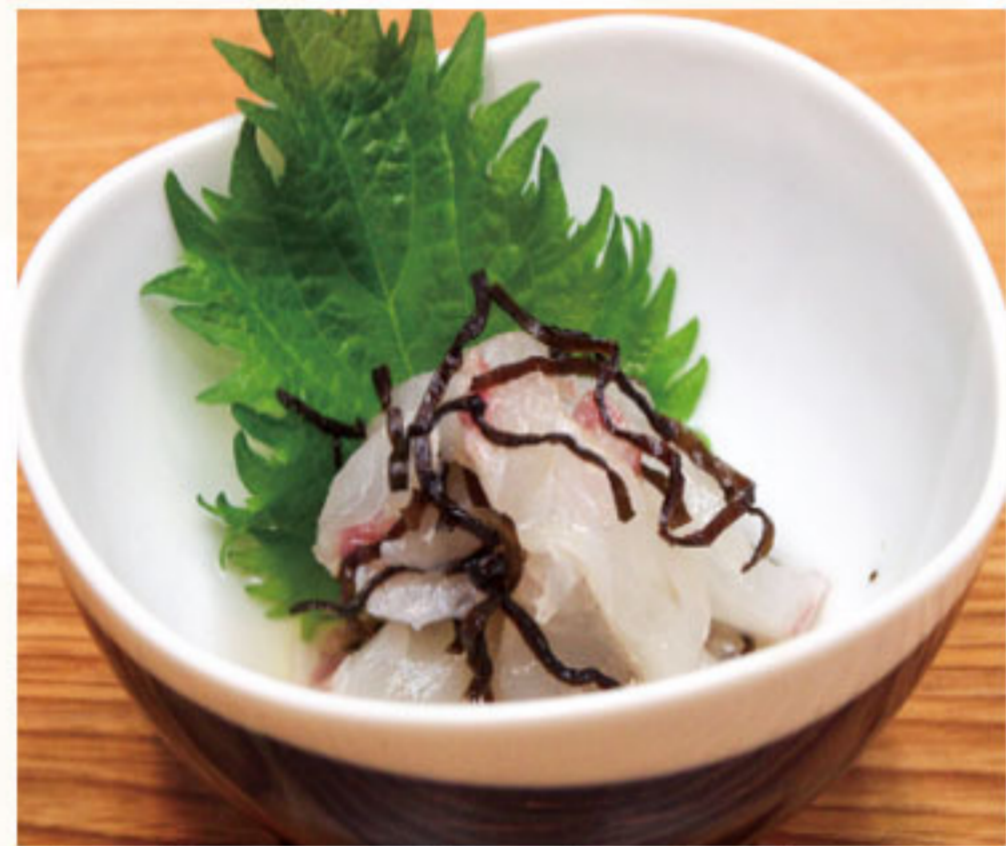
白身の塩昆布和え