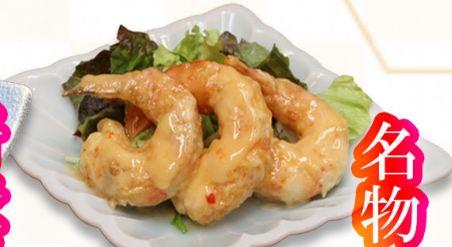
寿司屋のえびマヨ 690円(税抜628円)