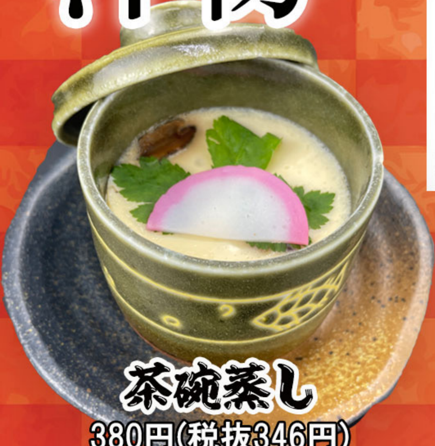
茶碗蒸し 380円(税抜346円)