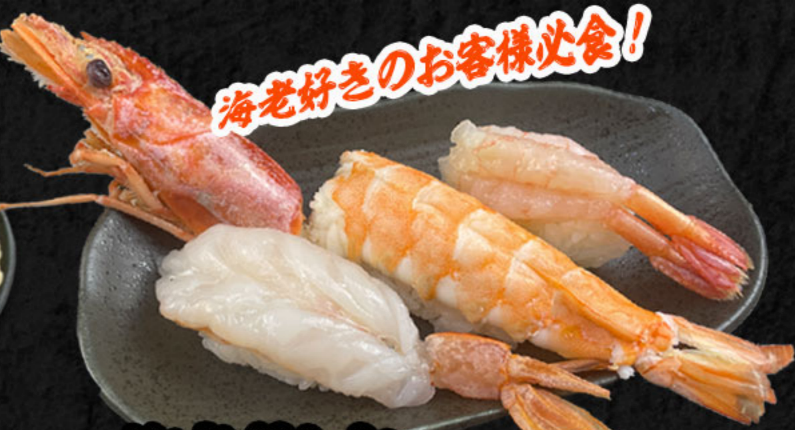
海老さんまい 630円(税抜573円) 特大赤海老・ゆで大えび・甘えび