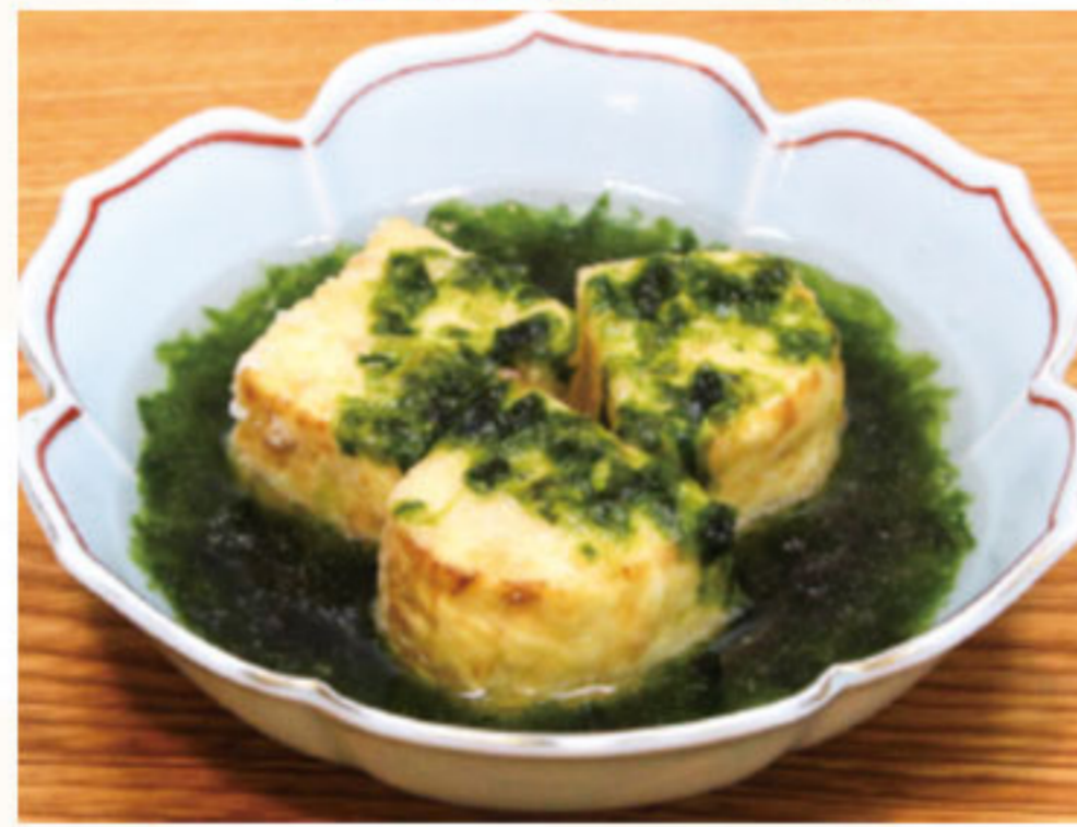
揚げ出し玉子 460円(税抜419円)