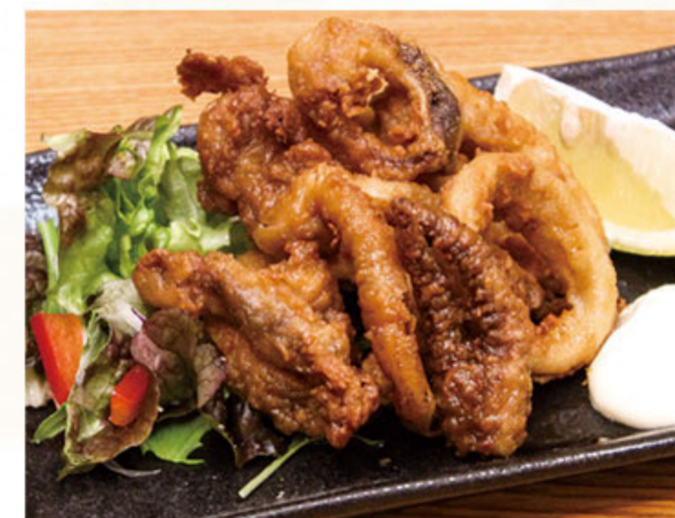
イカの唐揚げ 460円(税抜419円)