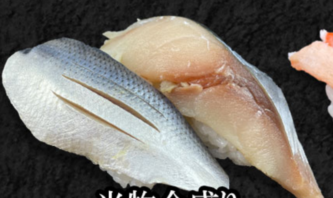
光物合盛り 280円(税抜255円) こはだ・メさば