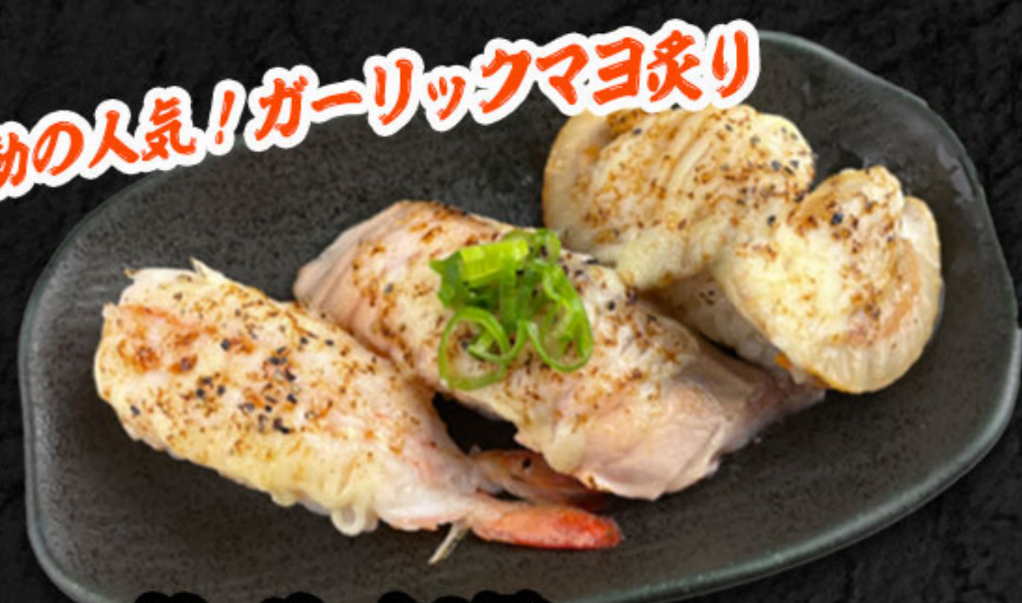
ガーリック3貫 580円(税抜528円) えび・サーモン・ほたて