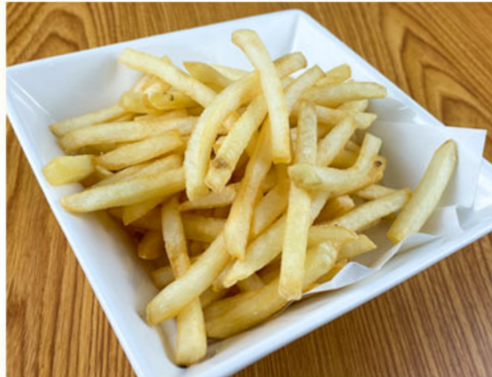
ダブルポテトフライ 560円(税抜510円)