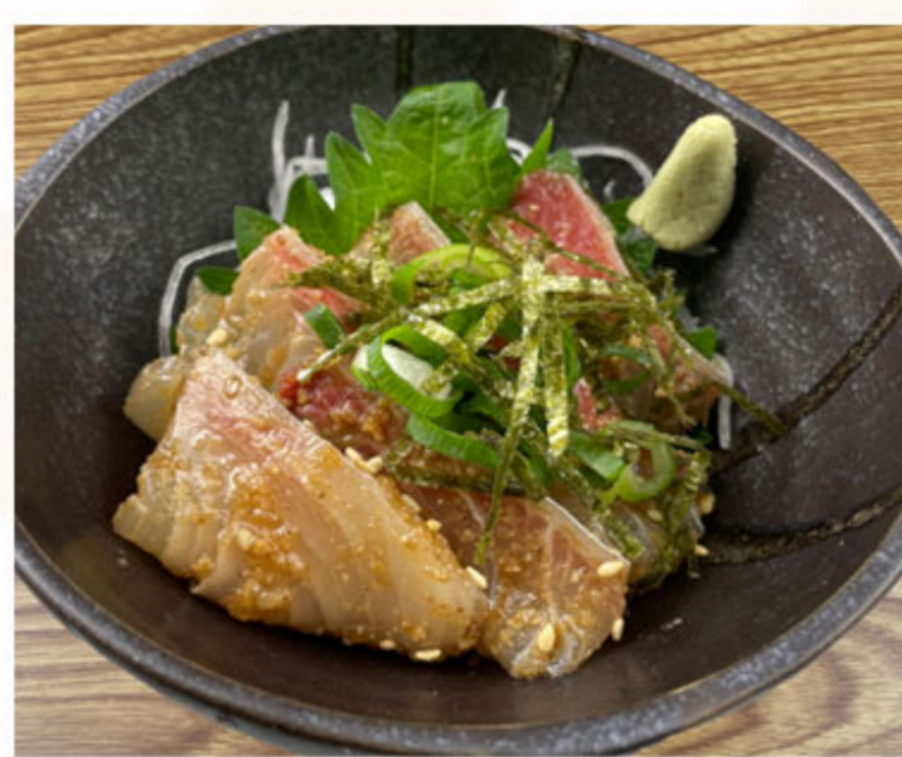
胡麻ダしかんぱち