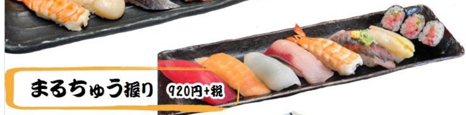
まるちゅう握り 920円+税