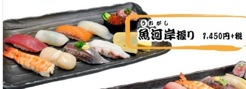
うおがし 魚河岸握り 7,450円+税

平日 11:30 → 13:50 まで 土曜日 11:00 → 14:50 まで