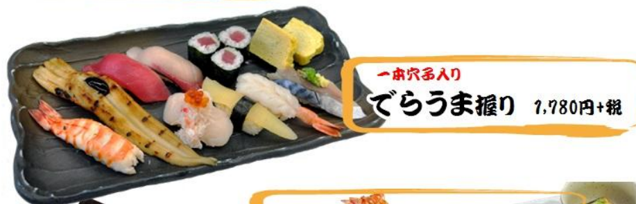
一本穴多入り であうま握り 7,780円+税